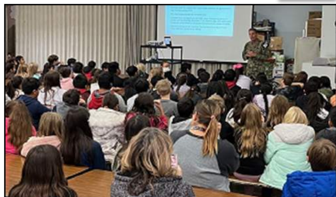
TES Veteran's Day Assembly / Día de los Veteranos del TES Asamblea